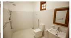
Sanitation in Style